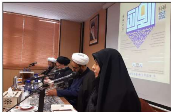
نخستین پیش همایش «مرجعیت علمی قرآن کریم» به همت مرکز پژوهش های اسلامی معصومیه برگزار شد.