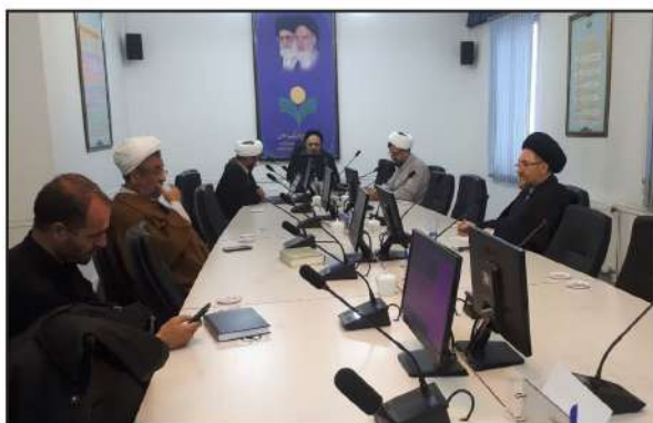
سومین همایش علوم انسانی-اسلامی، پژوهش و فناوری

کرسی ترویجی نظریه رشد اخلاقی قرآن بنیان از سلسله برنامه های سومین همایش علوم انسانی-اسلامی، پژوهش و فناوری برگزار شد.