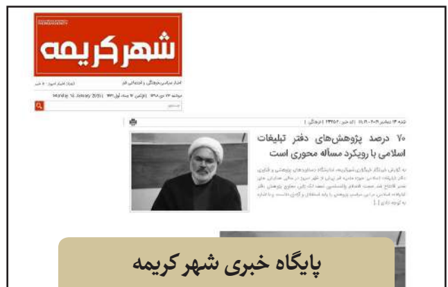
پایگاه خبری شهر کریمه