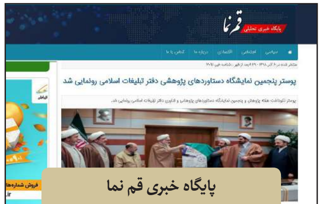
پایگاه خبری قم نما