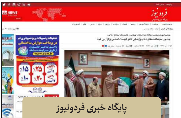
پایگاه خبری فردونیوز