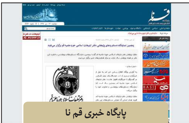
پایگاه خبری قم نا